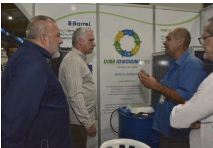
Staatspräsident der Republik Kuba Miguel Díaz-Canel auf der Messe (zweiter von links)

Der Tenor in Vorträgen und in der Diskussion war, dass die Nutzung der Solarenergie essentiell für den Energiesektor in Kuba sei. Zugleich müsse die Energieeffizienz gesteigert und die nationale Industrie gezielt gefördert werden, um souveräne Technologien zu entwickeln und anzuwenden sowie Importe zu vermeiden.