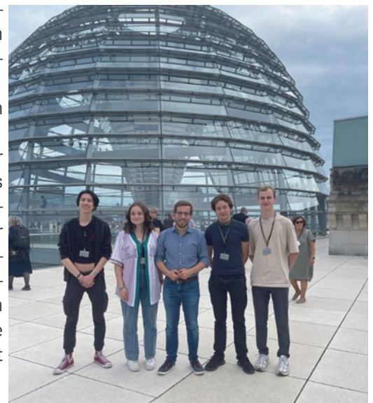
Linksjugend Goslar mit dem Abgeordneten Victor Perli (Mitte)